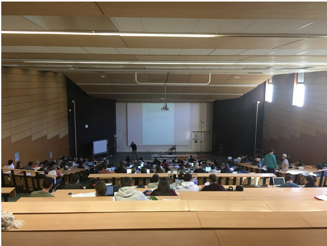
Un cours en amphi