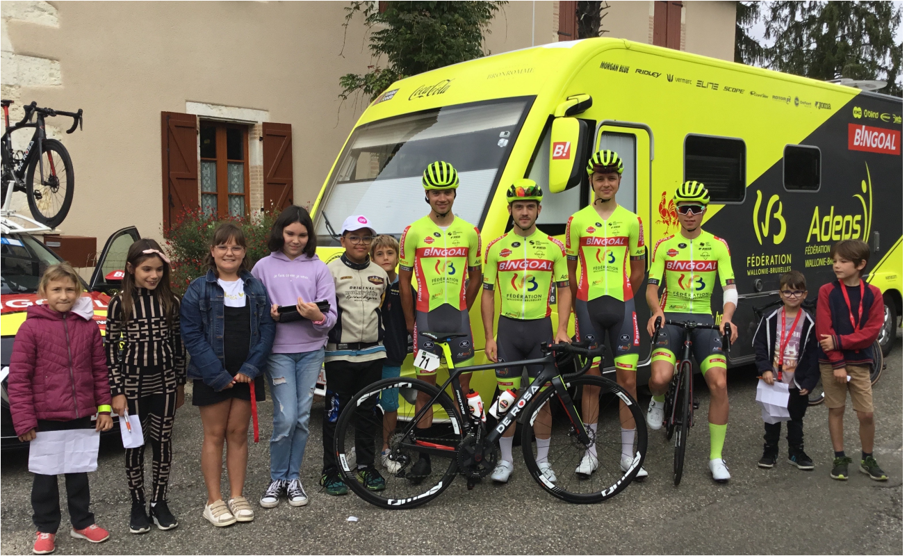
Interview des coureurs