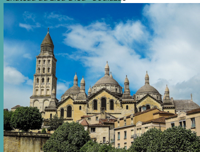
Cathédrale Saint-Front Périgueux

S ituée au centre du Périgord, Boulazac Isle Manoire est une ville nouvelle de l'agglomération de Périgueux qui regroupe 4 anciennes communes. Elle est idéalement située pour visiter la région et son patrimoine architectural, profiter du charme des paysages.