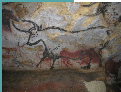
Salle des Taureaux - Lascaux

Il est grand temps de s'inscrire pour nous rejoindre dans ce beau programme !