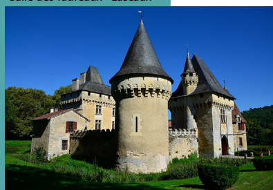
Chateau du Lieu-Dieu - Boulazac