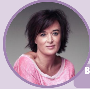
Béatrice de la Boulaye