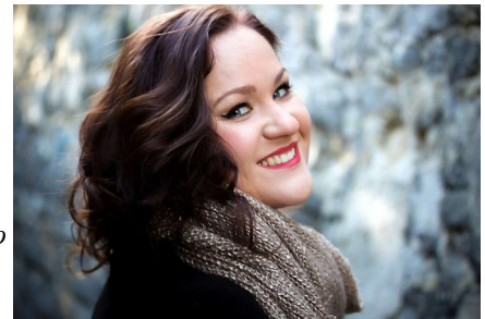
Eléonore PANCRAZI , mezzo-soprano